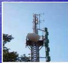
Figura 2 - Impianti RTV

Un impianto emittente radio-TV è costituito da una o più antenne trasmittenti, la cui funzione è quella di convertire un segnale elettrico in un'onda elettromagnetica ad alta frequenza in grado di propagarsi attraverso lo spazio e di trasportare le informazioni fino ad una o più antenne riceventi, le quali operano la riconversione dell'onda elettromagnetica in un segnale elettrico che giunge agli apparecchi televisivi e radiofonici.