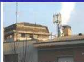
Figura 1 - Impianto RSB