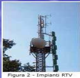
Figura 2 - Impianti RTV

Esse sono gli impianti per radiotelecomunicazione e con precisione :