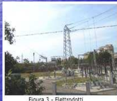
Figura 3 - Elettrodotti